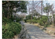
林は昔は庭園だった